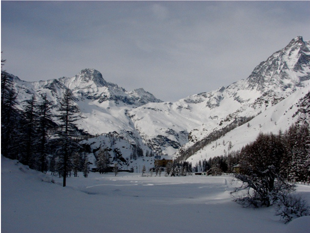
Il Piano della Mussa in inverno